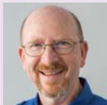
Dr. Werner Weishaupt

Präsident des VFP Montag 11.00 – 12.30 Uhr Supervision nach Vereinbarung Sprechstunde für allgemeine und persönliche Verbandsfragen, Anregungen und Vorschläge zur Verbandsarbeit Donnerstag 17.00 – 18.30 Uhr