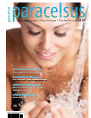
VFP-Mitgliedermagazine „Freie Psychotherapie“ und „Paracelsus“